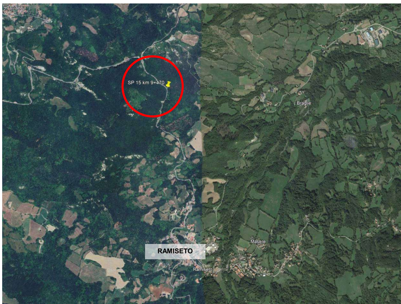
Figura 1 – Ortofoto dell’area oggetto di intervento lungo la S.P. 15 dal km 9+430 al km 9+510.