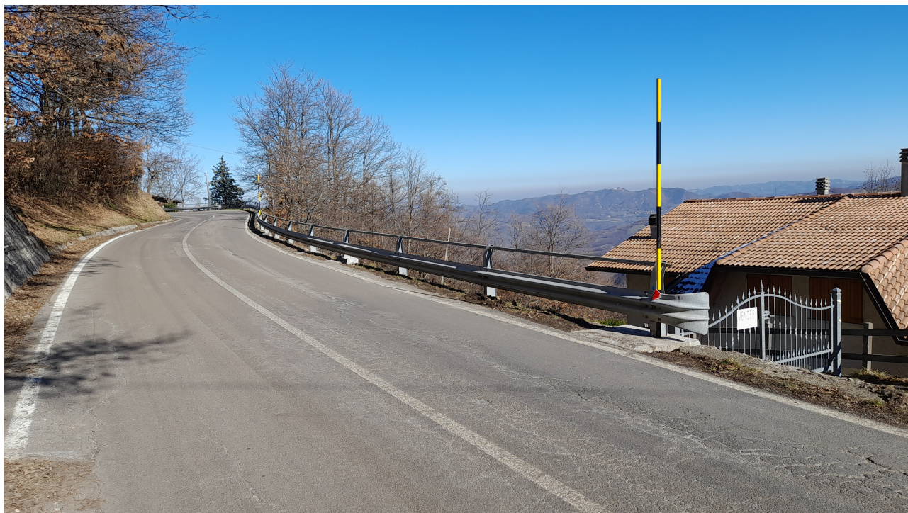
Figura 2 – Vista del tratto di strada provinciale e della barriera esistente al km 8+000.

I lavori dell'intervento in progetto sono affidati nell'ambito dell'Accordo Quadro in essere "Interventi di messa in sicurezza delle strade provinciali con servizio di pronto intervento - reparto sud. Accordo quadro 2021-2022", con specifico affidamento n. 7.