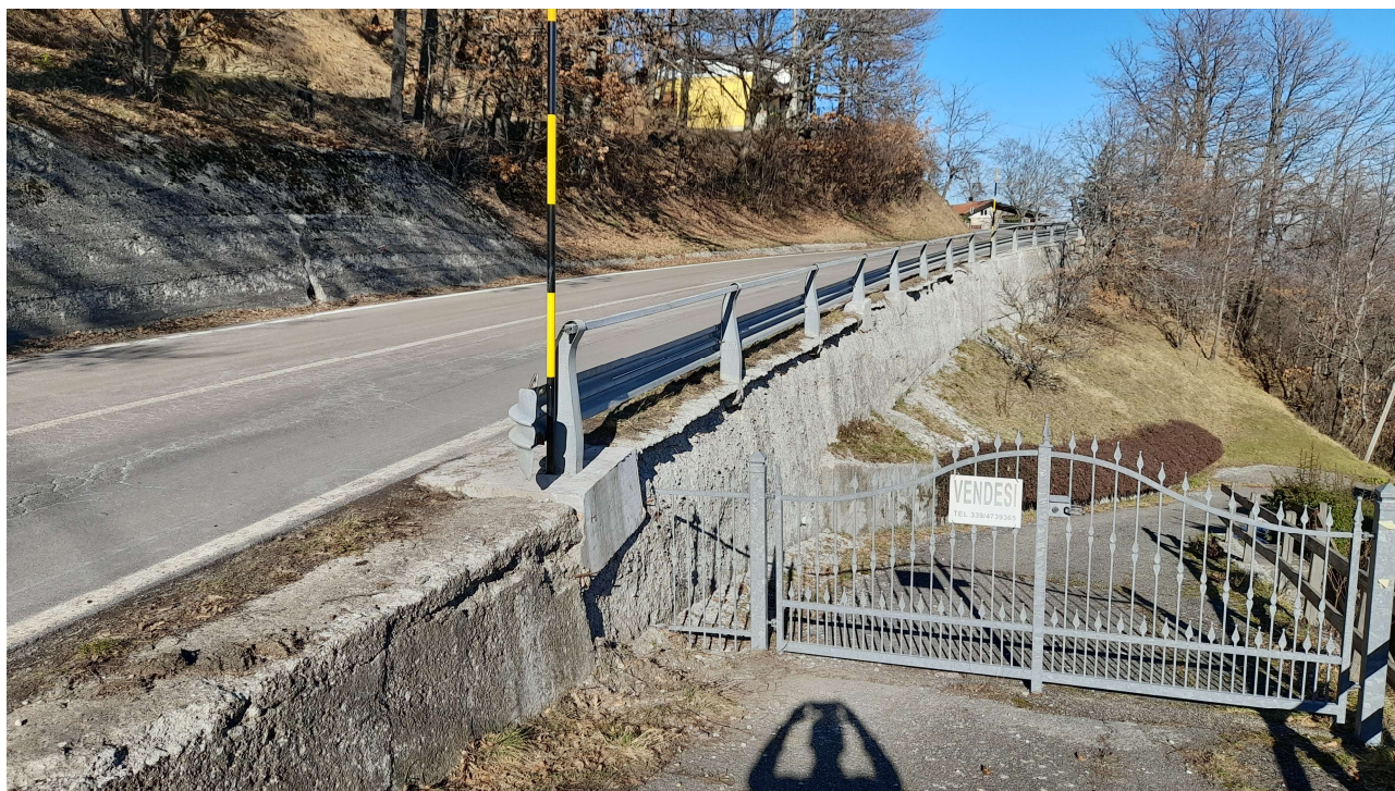
Figura 3 – Vista del muro di sostegno esistente in calcestruzzo.